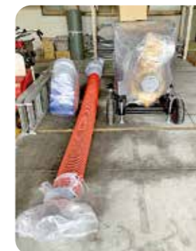
貸与用可搬式ポンプ (R元年度納品・貸与開始)