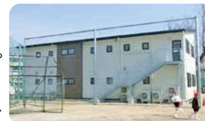
福浜小学校児童クラブ