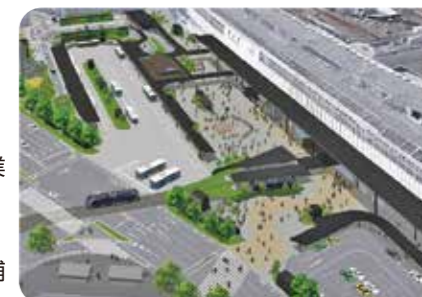
岡山駅前広場のデザイン計画